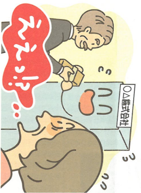
社長が会社に貸している貸付金も相続財産になる