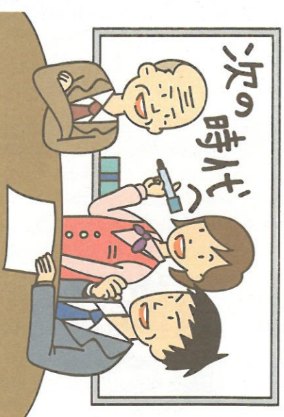
事業承継は経営革新・経営改善を行う絶好の機会でもある